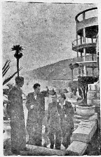
Грузинская ССР. Круглый год действует санаторий «Челюскинец» в Гагре. Сейчас здесь отдыхает большое количество трудящихся.